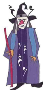
グランベリーノ閣下 "不思議な音の国"より