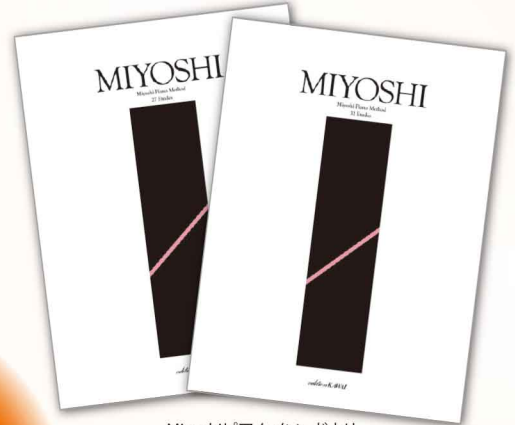
Miyoshiピアノ・メソッドより 32の練習曲／27の練習曲 ～響きあうピアノ～ 三善 晃作曲

「Miyoshiピアノ・メソッド全12巻」に収録された300を超える練習曲の中より、発表会、コンサート、コンクール等で演奏される機会が多い作品を中心に選曲し編集された『Miyoshi 32』『Miyoshi 27』。この2冊を使用し、Miyoshiピアノ・メソッドとの関わりをひも解いていながら、いっしょに表現力について考えていきたいと思います。