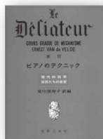
ピアノのテクニク