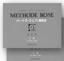
メトードローズ・ ピアノ教則本 幼児用 上巻・下巻