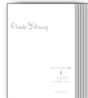
ドビュッシー ピアノ曲集 I~IX