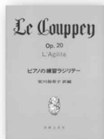
ピアノの練習 ラジリテー