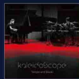
天平 & 真央樹 kaleidoscope VICJ-61760 / 定価 ¥2,500+税