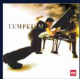
1st アルバム TEMPEIZM CD+DVD(2枚組) TOCP-70511 ¥3,000(税込)