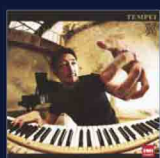
2nd アルバム 翼 TOCP-70809 ¥2,800(税込)