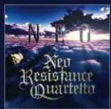
Neo Resistance Quartetto NEO NRCD-0003 ¥2,700(税込)