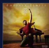
3rd アルバム 火の鳥 vol.1 COCO-84941 ¥2,940(税込)