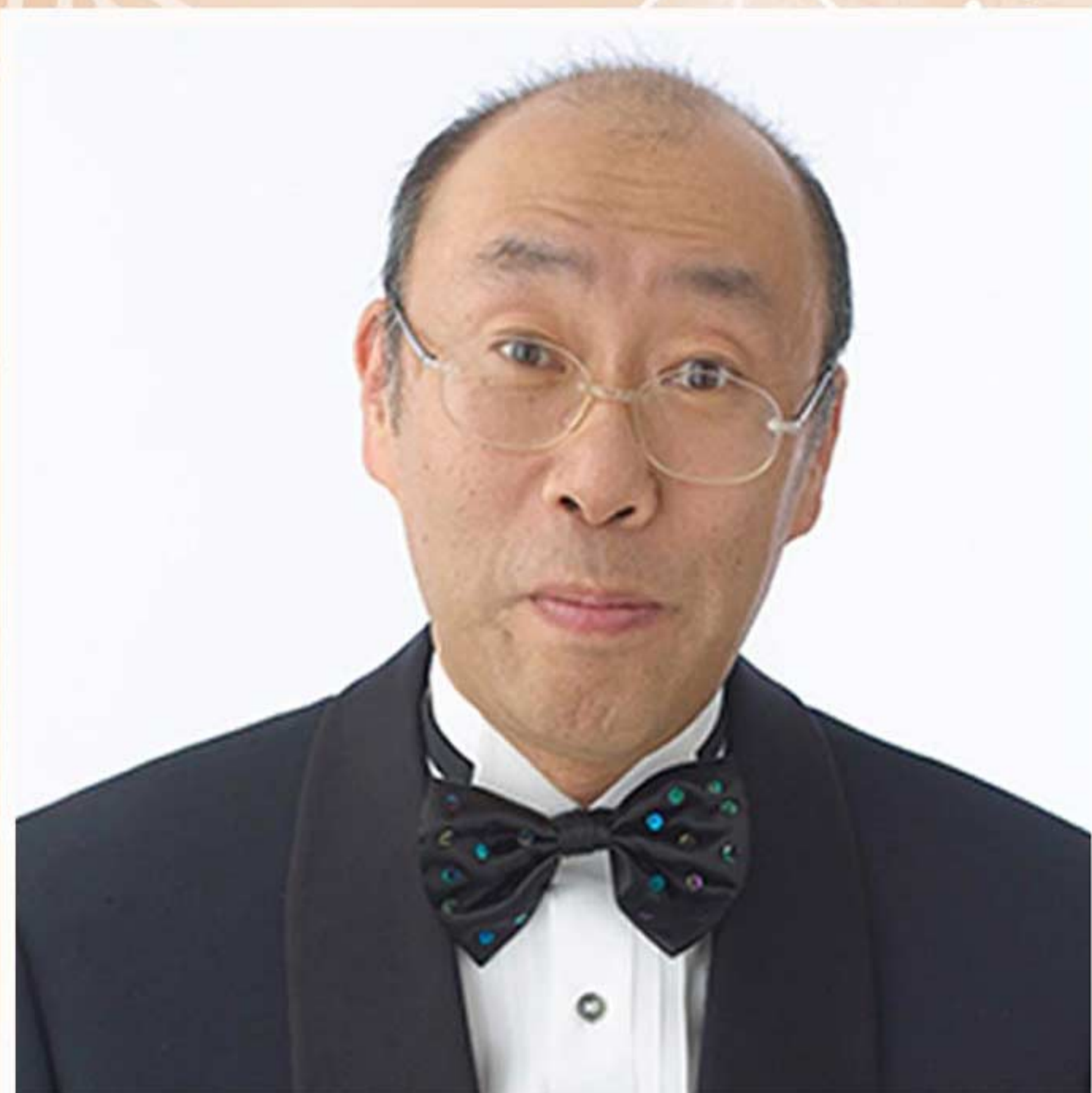
青島 広志 Hiroshi Aoshima