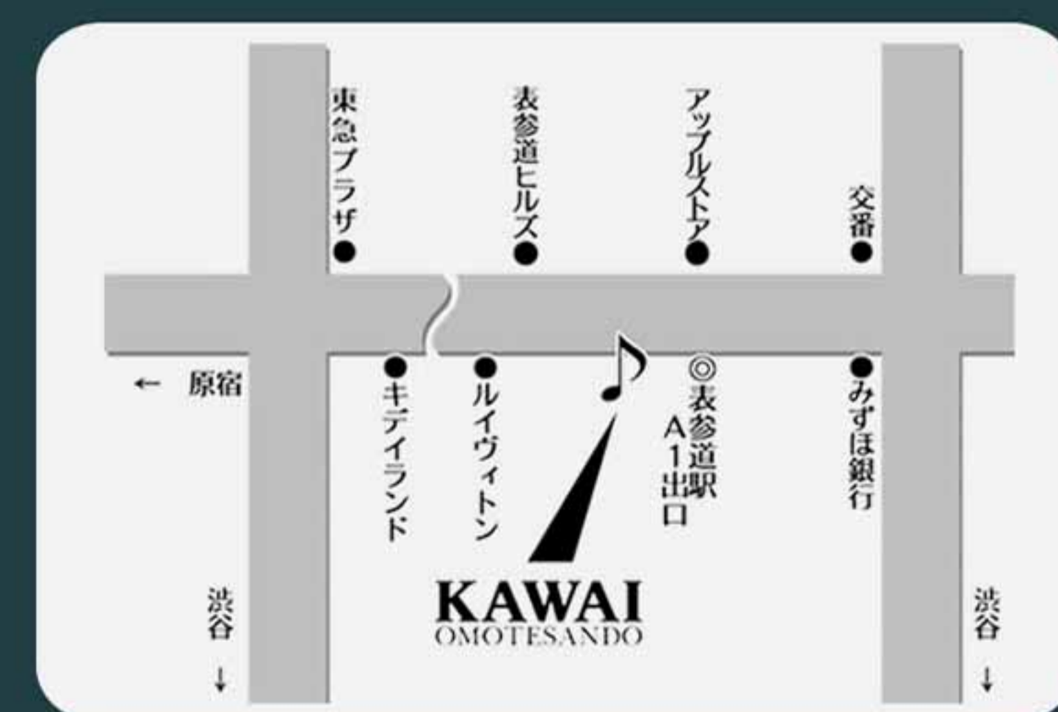
アクセス：東京メトロ表参道駅A1出口より徒歩2分

Tel.03-3409-2511 Fax.03-3409-2598 ✉omotesando@kawai.co.jp