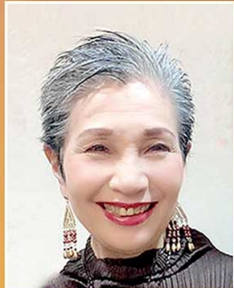
山姥 三橋 千鶴