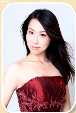
メゾソプラノ 実川 裕紀