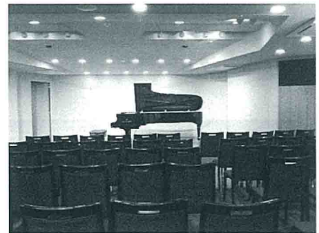
(写真) カワイ名古屋コンサートサロン“Bourree”

《後援》 文部科学省、愛知県教育委員会、(株)河合楽器製作所 《協力》 ピティナ名古屋栄支部