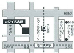
▲カワイ名古屋略地図