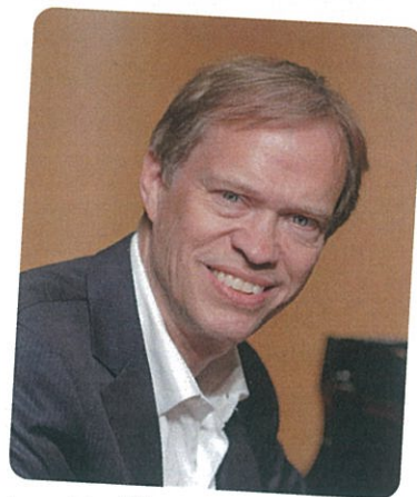
ランディー・フェイバー