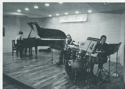
(写真) 過去の名古屋ポピュラーステップ ジャズピアノトリオの様子

憧れのポピュラー曲で参加してみませんか? 名古屋ポピュラー地区 今年も開催決定!