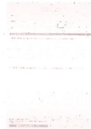
セミナーレポート