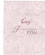
指導者パスポート