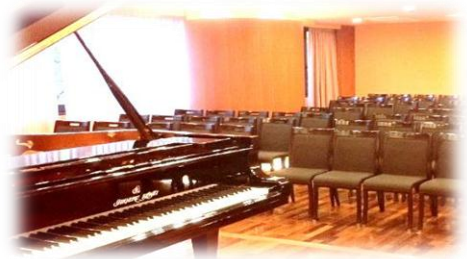
使用ピアノは数々の国際コンクールでも公式ピアノとして採用されている、カワイフルコンサートピアノ「SK-EX」です。