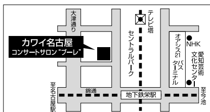
名古屋市営地下鉄 東山線・名城線「栄」駅下車、3番出口より徒歩1分