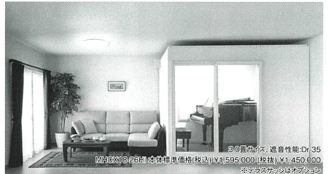
3.0畳サイズ、遮音性能:Dr-35 MHCX18-26H1 本体標準価格(税込) ¥1,595,000 (税抜) ¥1,450,000 ※テラスサッシはオプション

スタンダードタイプの特徴に加え、豊富なサイズバリエーションとオプションで様々な用途にお応えします。