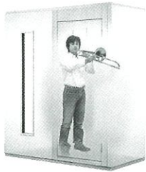
1.5畳サイズ、遮音性能:Dr-30 LVSX13-18 本体標準価格(税込) ¥726,000 (税抜) ¥660,000 ※FIX窓はオプション