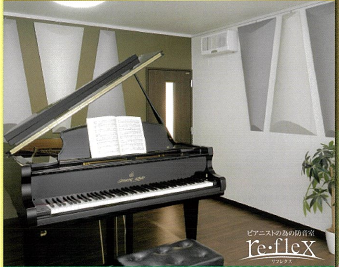
ピアニストのための防音室 re·flex リフレクス