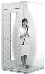
0.8畳サイズ、遮音性能:Dr-30 LVSX09-13 本体標準価格(税込) ¥550,000 (税抜) ¥500,000