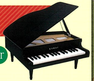
ミニピアノ1141ブラック

本物のグランドピアノの風合いや音色が楽しめる、32鍵のミニピアノです。本体サイズ: 425x450x205mm(脚付き・蓋閉じ状態)