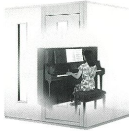
2.0畳サイズ、遮音性能:Dr-35 MHSX18-18 本体標準価格(税込) ¥1,221,000 (税抜) ¥1,110,000 ※FIX窓はオプション