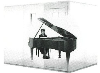
3.0畳サイズ、遮音性能:Dr-35 MHSX18-26 本体標準価格(税込) ¥1,452,000 (税抜) ¥1,320,000 ※FIX窓はオプション