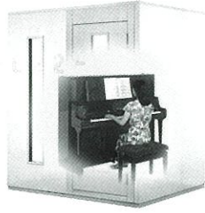
1.7畳サイズ、遮音性能:Dr-30 LVSX18-15 本体標準価格(税込) ¥847,000 (税抜) ¥770,000 ※FIX窓はオプション