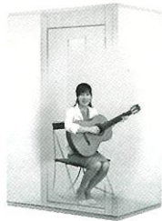
1.2畳サイズ、遮音性能:Dr-30 LVSX13-13 本体標準価格(税込) ¥638,000 (税抜) ¥580,000