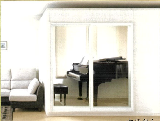
ユニットカスタム