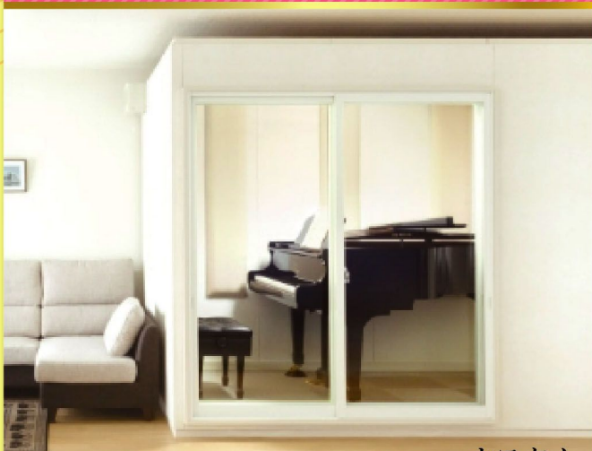
ユニットカスタム