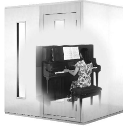
2.0畳サイズ、遮音性能:Dr-35 MHSX18-18 本体標準価格(税込) ¥1,221,000 (税抜) ¥1,110,000 ※FIX窓はオプション