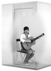
1.2畳サイズ、遮音性能:Dr-30 LVSX13-13 本体標準価格(税込) ¥638,000 (税抜) ¥580,000