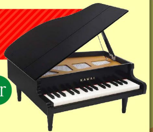
ミニピアノ1141ブラック