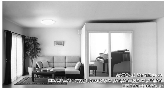
3.0畳サイズ、遮音性能:Dr-35 MHCX18-26H1 本体標準価格(税込) ¥1,595,000 (税抜) ¥1,450,000 ※テラスサッシはオプション

スタンダードタイプの特徴に加え、豊富なサイズバリエーションとオプションで様々な用途にお応えします。