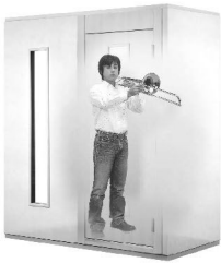
1.5畳サイズ、遮音性能:Dr-30 LVSX13-18 本体標準価格(税込) ¥726,000 (税抜) ¥660,000 ※FIX窓はオプション