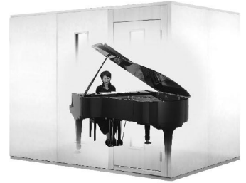
3.0畳サイズ、遮音性能:Dr-35 MHSX18-26 本体標準価格(税込) ¥1,452,000 (税抜) ¥1,320,000 ※FIX窓はオプション