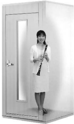
0.8畳サイズ、遮音性能:Dr-30 LVSX09-13 本体標準価格(税込) ¥550,000 (税抜) ¥500,000