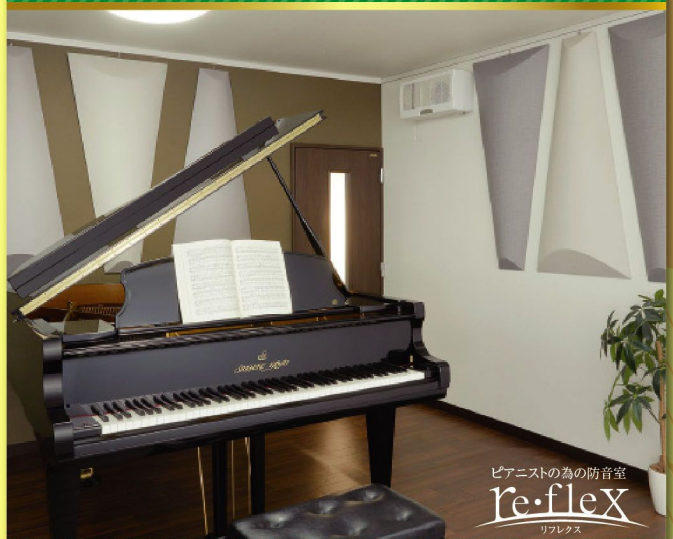
ピアニストの為の防音室 re·flex リフレックス