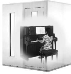
1.7畳サイズ、遮音性能:Dr-30 LVSX18-15 本体標準価格(税込) ¥847,000 (税抜) ¥770,000 ※FIX窓はオプション